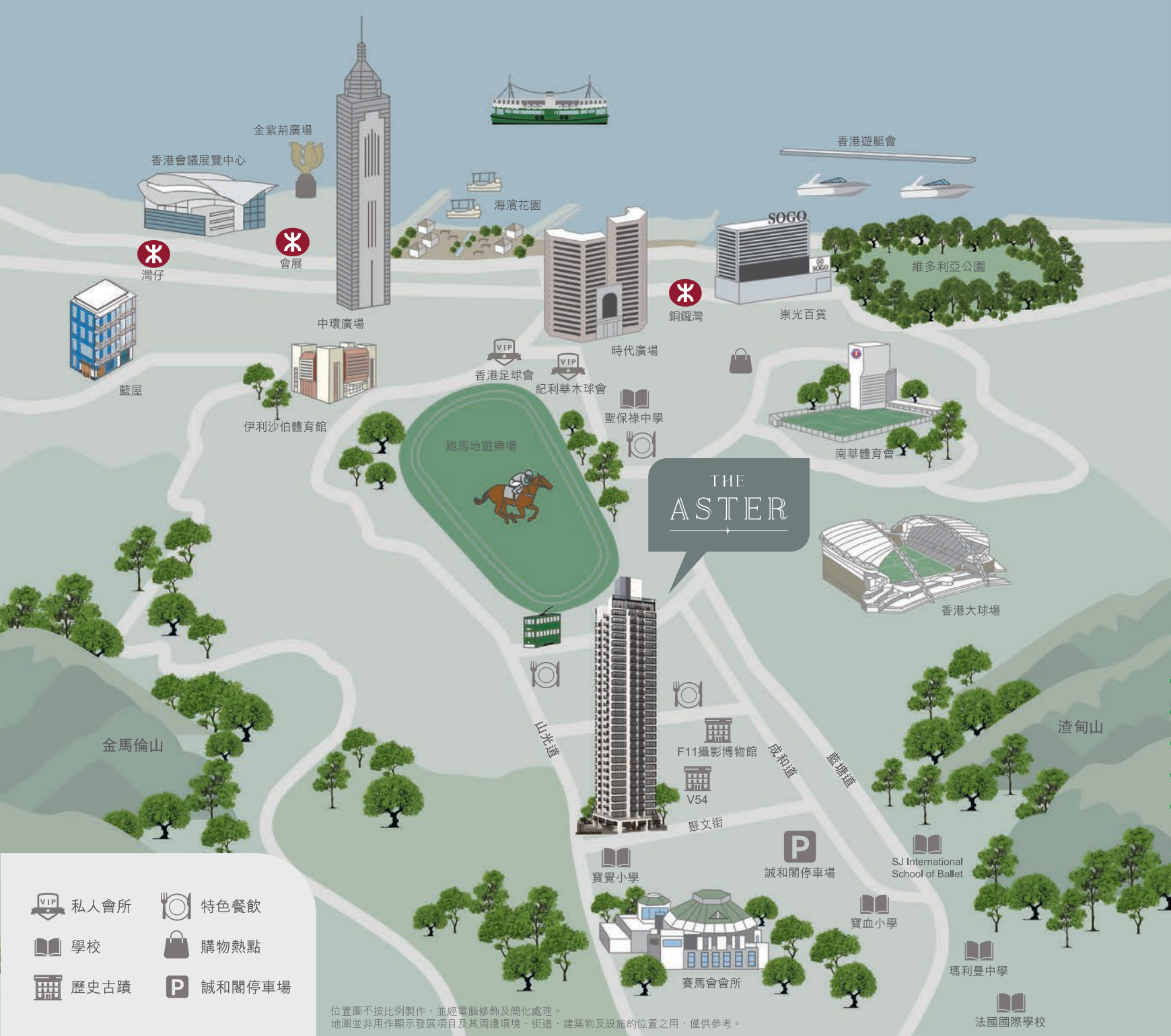
位置圖不按比例製作，並經電腦修飾及簡化處理。 地圖並非用作顯示發展項目及其周邊環境、街道、建築物及設施的位置之用，僅供參考。